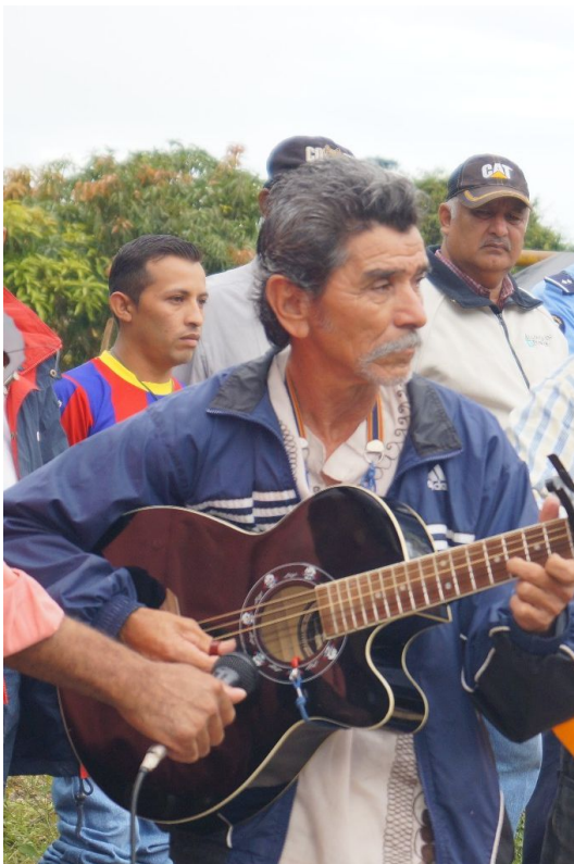
Padres de Familia Actividades Culturales

Financieramente ha sido apoyado año con año por la Asociación de Amistad Solingen con Jinotega y Casa bajo el Arcoíris en coordinación con el Ministerio de Educación.