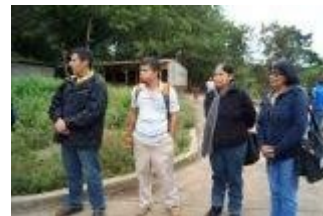
Docentes del Centro Acto día de Puertas Abiertas